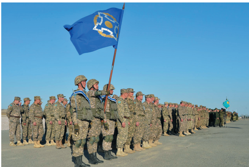
Открытие учений «Поиск-2018» на полигоне «Гвардейский»

со стороны террористических и экстремистских организаций в Центральной Азии, определен комплекс политических и дипломатических мер по предотвращению военного конфликта. Только при невозможности его предотвращения политическими методами, путем переговоров, включаются варианты военного реагирования, направленного на локализацию этих угроз.