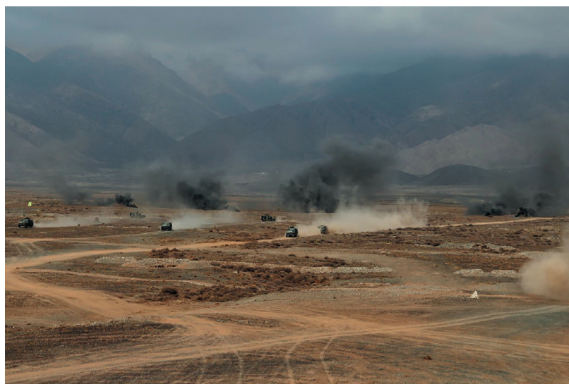
Отработка действий по разгрому незаконных вооруженных формирований

В ходе тренировки, на примере созданной учебной обстановки, были детально проанализированы вероятные угрозы