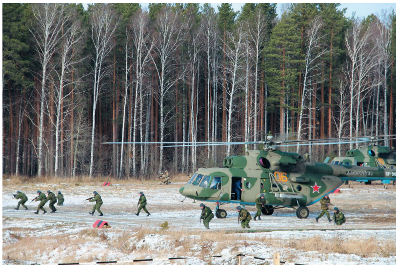
Действия воздушного десанта в ходе учений «Нерушимое братство-2018» на полигоне ЦВО ВС РФ

— Общая численность Миротворческих сил ОДКБ, в состав которых для выполнения миротворческих задач государствами — членами ОДКБ на постоянной основе выделены военный, милиционный (полицейский) и гражданский персонал, составляет около 3600 человек.