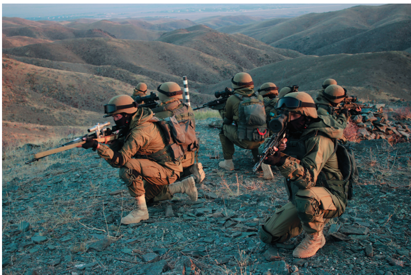
Учения разведывательных служб и подразделений «Поиск-2018»

В заключение хочу выразить уверенность, что Организация Договора о коллективной безопасности сможет и в дальнейшем успешно обеспечивать военную безопасность и суверенитет государств — членом ОДКБ.