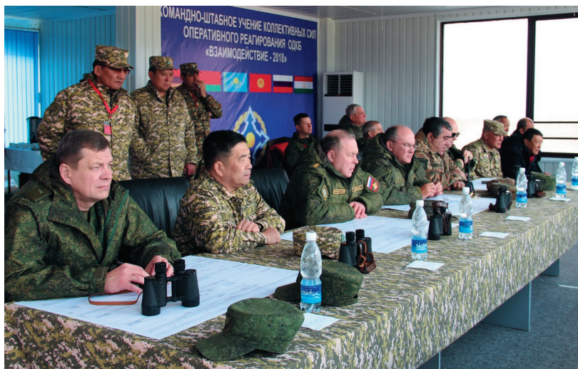
Руководство учений «Взаимодействие–2018»

В нынешнем году в боевой подготовке главное внимание уделялось подготовке батальонных тактических групп как основной тактической единицы